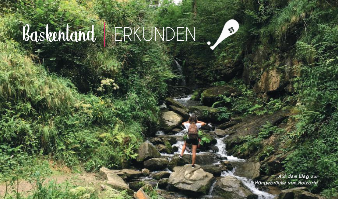
Auf dem Weg zur Hängebrücke von Holzart